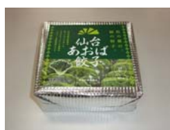
株式会社海祥のお土産用