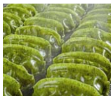
スタンダードタイプ

仙台市では、「仙台あおば餃子」を提供していただける飲食店や製造していただける食品加工場などを募集しています。詳しくはお問い合わせください。