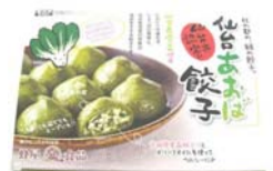
蜂屋食品株式会社のお土産用